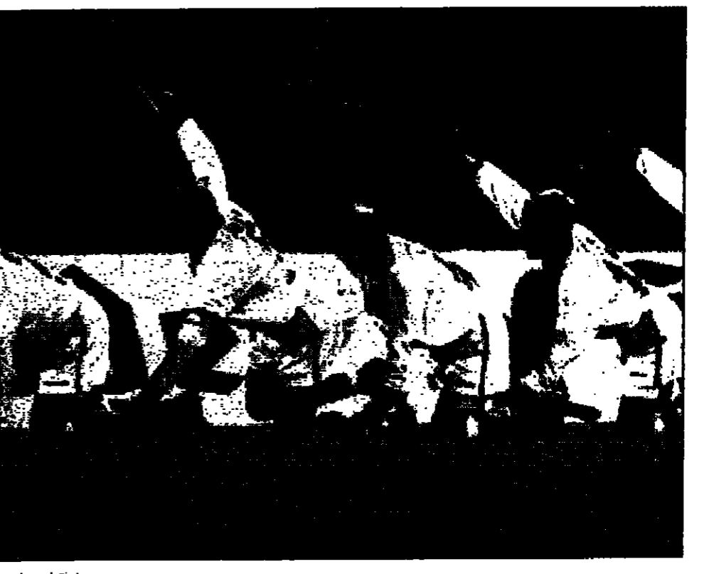
فريق ايرمارتن الانكلي خلال التدريب